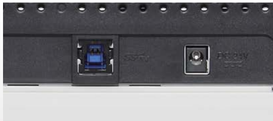
Hohe Geschwindigkeit über USB 3.0 Schnittstelle