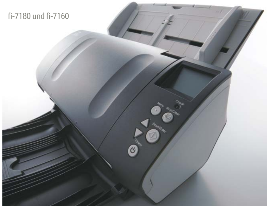
fi-7180 und fi-7160