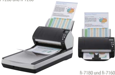
fi-7180 und fi-7160

fi-7160/fi-7260 – (A4-Hoch) bei 300 dpi 60 S./Min. | 120 B./Min. fi-7180/fi-7280 – (A4-Hoch) bei 300 dpi 80 S./Min. | 160 B./Min.